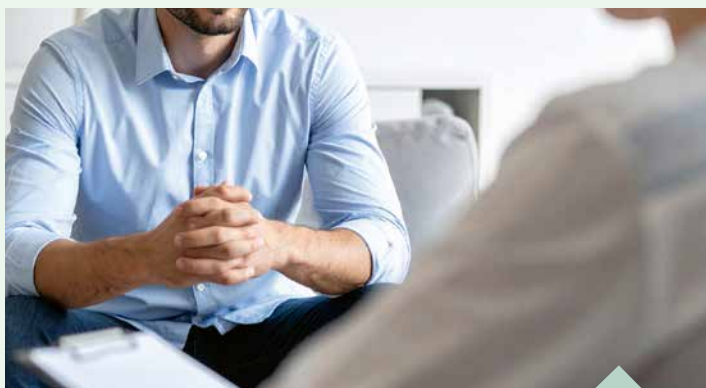
Eine Krebsdiagnose wirft viele Fragen auf. Hier kann die Beratung helfen.

So zeigten wissenschaftliche Studien, dass zwischen 33 und 60 Prozent der jeweils untersuchten Krebserkrankten unter hoher psychosozialer Belastung leiden. „Mit dieser Diagnose soll keiner allein bleiben. Ich freue mich deshalb wirklich sehr, dass sich die mobile Krebsberatung unter Trägerschaft unserer Krebsgesellschaft MV seit