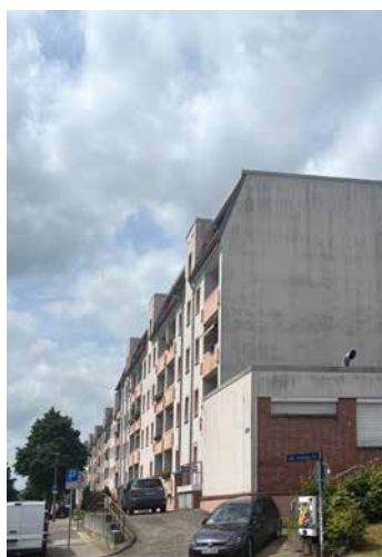
Lischstraße heute: Zu DDR-Zeiten entstanden Neubauten.