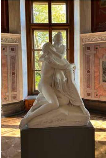
Hero und Leander im Nachguss: Das Original verschwand 1918.

Legendäres Liebespaar dank eines Spendenprojekts wieder auf dem Sockel