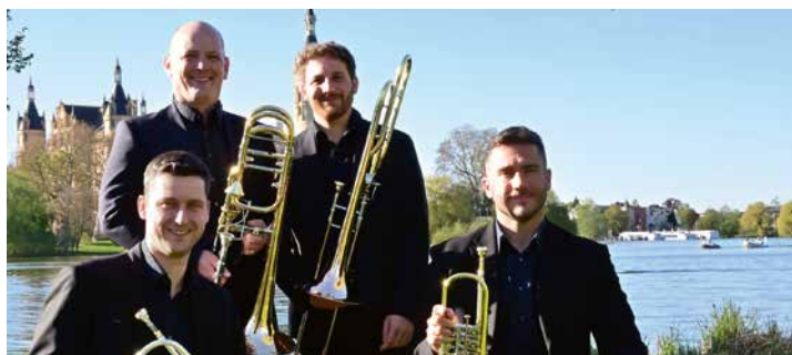
Das Bläserquartett des Staatstheaters

Weisse Flotte lädt zum stimmungsvollen Törn