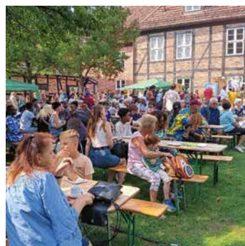
Der Afrikatag im Schleswig-Holstein-Haus hat schon Tradition.

Ein Highlight sind sicher auch die Köstlichkeiten aus der afrikanischen Küche, die an diesem Tag