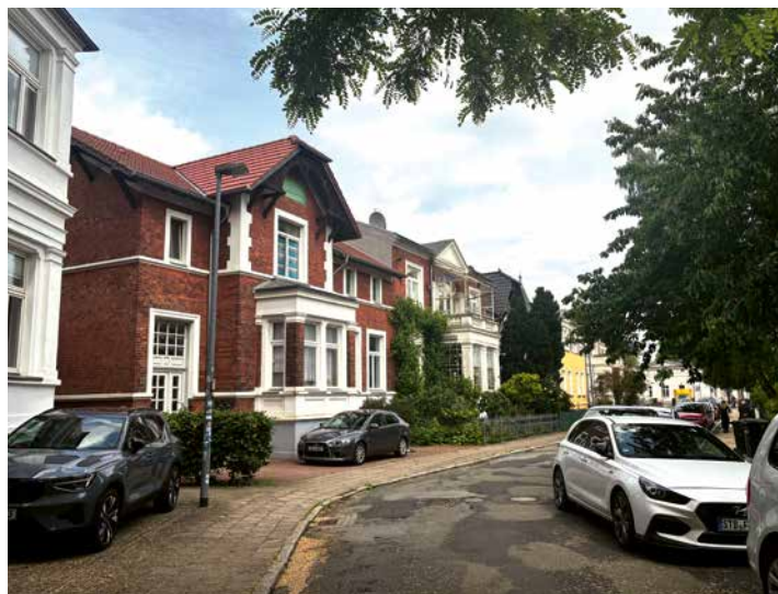
Blick in der Lutherstraße: Die Häuser auf der linken Seite waren einst Wassergrundstücke – auf ihrer Rückseite bildete die Seeke die Stadtgrenze.

In der zweiten Hälfte des 19. Jahrhunderts wurde es in Schwerin voll. Die Einwohnerzahl verdoppelte sich, der Bedarf an Wohnraum wuchs, die Häuser standen enger und wurden höher. Gleichzeitig wuchs damit auch der Wunsch der Gutbetuchten, sich zum Wohnen einen Flecken mit mehr Platz und mehr Luft zum Atmen zu sichern. In der Stadt wa-