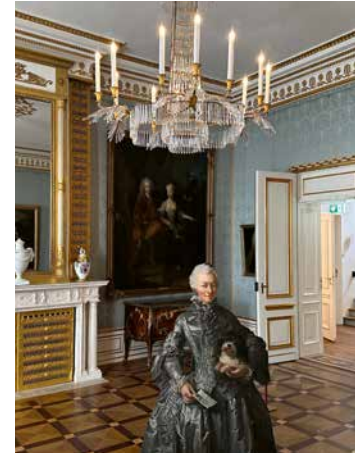
Brettfigur von Herzogin Luise Friederike mit Schoßhündchen