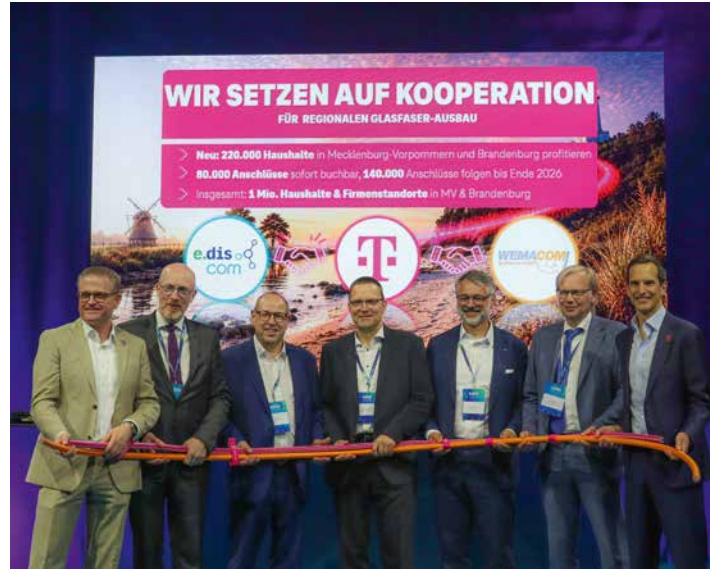
Auf der Digitalmesse NØRD in Rostock wurde Ende Mai die langfristige Open-Access-Kooperation vorgestellt.

Die WEMACOM erreicht einen weiteren Meilenstein beim Ausbau der digitalen Glasfaserinfrastruktur in MV: Künftig können Kunden neben den Produkten der WEMAG auch Glasfaserprodukte der Telekom über das geförderte Netz der WEMACOM nutzen. Rund 140.000 Haushalte und Unternehmensstandorte im geförderten Netzgebiet der WEMACOM erhalten dadurch perspektivisch eine zusätzliche Wahlmöglichkeit bei ihrem Glasfaseranbieter. Die Vermarktung durch die Telekom erfolgt schrittweise. Telekom-Glasfasertarife werden voraussichtlich ab Ende 2026 sukzessive buchbar sein. Die Open-Access-Kooperation baut auf der geförderten Glasfaser-Infrastruktur auf, die in den vergangenen Jahren insbesondere in ländlichen Regionen Mecklenburg-Vorpommerns entstand. Als Tochter des regionalen Energieversorgers WEMAG hat die WEMACOM