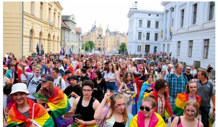
Bunt, fröhlich, weltoffen: Das ist der CSD. In diesem Jahr findet die Veranstaltung am 4. Juli statt.