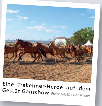
Eine Trakehner-Herde auf dem Gestüt Ganschow

Zum 27. Mal lädt das Gestüt Ganschow in diesem Sommer zur traditionellen Stutenparade ein. Besucher können sich auf eine Mischung aus Zucht, Sport und beeindruckender Show freuen. Termine sind am 5. und 12. Juli, jeweils am Sonntag, und am 18. Juli, einem Sonabend, auf dem Gestüt Ganschow südwestlich von Güstrow. Einlass ist ab 9 Uhr. Bis 12 Uhr können sich Besucher über das Gestüt informieren und haben die Möglichkeit, in die Ställe zu schauen. Um 13 Uhr beginnt dann das Showprogramm mit rund 20 Schaubildern. In einer liebevoll choreografierten Mischung aus Zucht, Sport und beeindruckender Show zeigt das Gestüt die ganze Bandbreite seiner Pferde. Ein sehr bewegendes Highlight ist dabei die historische Nachstellung der Flucht