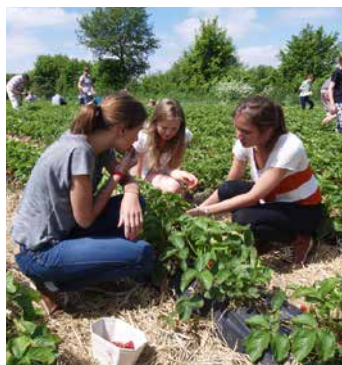
Selbstpflücker können in Gramkow in Nordwestmecklenburg Erdbeeren für den Eigenbedarf ernten.

Noch frischer geht es nur beim Selbstpflücken! Auf dem Feld in Gramkow an der Landesstraße 01 zwischen Gägelow und Klütz kön-