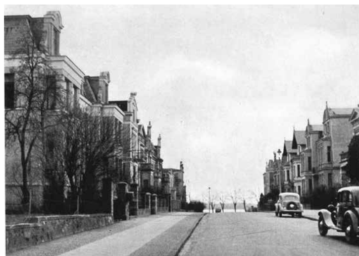
Das Foto von 1939 zeigt die Villen in der Regentenstraße, der heutigen Lischstraße. Sie sind heute nicht erhalten.