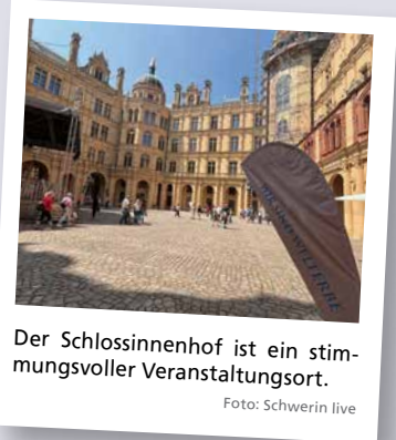
Der Schlossinnenhof ist ein stimmungsvoller Veranstaltungsort.