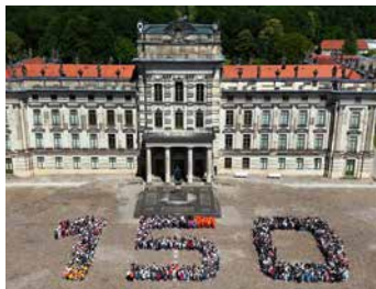
In Ludwigslust werden 150 Jahre Stadtrecht gefeiert.

Am 20. Juni wird die Innenstadt zur großen Festmeile. In der Alexandrinenplatz, Schloßstraße und