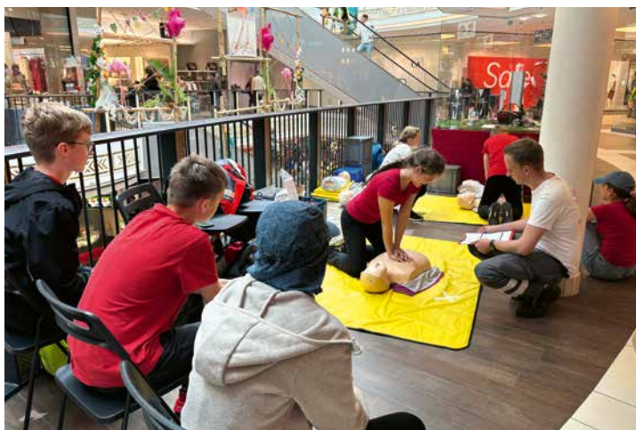
Die Schulsanitäter zeigen am 20. Juni unter anderem, wie eine Herzdruckmassage funktioniert.

Sieben Stationen wird es in der Marienplatz-Galerie geben. Dazu gehören auch solche, an denen geschminkte Verletzten-Darsteller realitätsnahe Unfallsituationen simulieren. „Es kommt darauf an, dass die Schüler in solchen Notfällen richtig reagieren“, sagt Leupold.