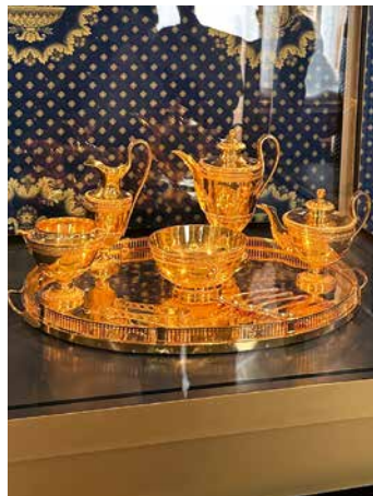
Das goldene Déjeuner-Geschirr aus St. Petersburg

stand der Dynastie nicht gesichert sei. Louises Sohn, der Erbprinz Friedrich Ludwig, heiratete dann sogar eine Zarentochter. Großfürstin Helena Pawlowna war 14-jährig, als sie aus St. Petersburg nach Ludwigslust kam. Ihr Brautschatz war unermesslich groß und ein goldenes Déjeuner-Geschirr aus der Mitgift glänzt im sanierten Westflügel hinter Glas. Das 13-teilige Service verschwand später aus dem Schloss und konnte 2017 mit Unterstützung mehrerer Stiftungen und Förderer für rund 1,2 Millionen Euro erworben werden. Heute ist es eines der bedeutendsten Objekte der Ausstellung. Helena Pawlowna war kein langes Leben beschieden: Sie starb 19-jährig kurz nach der Geburt ihres zweiten Kindes. Helenas äl-