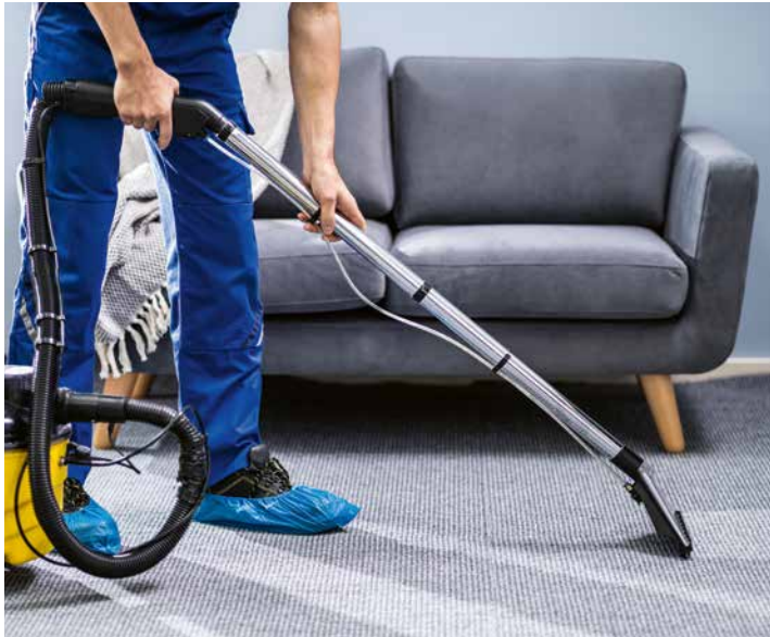
Die private Haushaltshilfe ist ein weiterer Baustein im Angebot von HDS.

Fachwissen, wenn es darum geht, unterschiedliche Oberflächen fachgerecht zu behandeln. Davon profitieren zum Beispiel Allergiker. Und nicht zuletzt können Probleme wie Schimmel im Bad bei einer regelmäßigen fachgerechten Reinigung erst gar nicht entstehen. ■