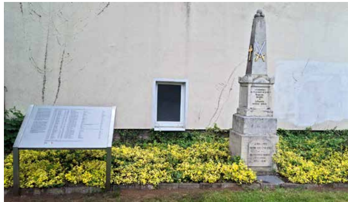
Zum Obelisk ist jetzt eine Gedenktafel mit den Namen der in Schwerin bestatteten Kriegsgefangenen gekommen.

te zu den entsprechenden Gedenktagen Blumenschmuck bekommt. Zusätzlich zum historischen Denkmal wurde nun eine Gedenktafel mit den Namen aller 50 hier bestatteten französischen Kriegsgefangenen eingeweiht. Grundlage dafür war ein Forschungsprojekt mit dem Titel „Die Vergessenen“ der Stiftung Mecklenburg zusammen mit dem Verein Le Souvenir Français. Eine mehrfache finanzielle Förderung des Deutsch-Französischen Bürgerfonds machte die länderübergreifenden Forschungen möglich. „Dass wir heute die Namen der Toten kennen, ist keine Selbstverständlichkeit. Es ist das Ergebnis einer bewussten Entscheidung – Erinnerung nicht dem Zufall zu überlassen, sondern sie aktiv zu gestalten“, sagt Schwerins stellvertretender Oberbürgermeister Bernd Nottebaum bei der Einweihung der Tafel im Mai.