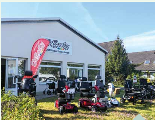
Für mehr Mobilität: Es wartet ein ganzer Fuhrpark, der sich an unterschiedliche Bedürfnisse richtet.

Jetzt freut sich das Team auf den Aktionstag am 1. Juli. Zu den Herstellern, die sich präsentieren, gehören unter anderem Otto Bock und Kinova, Saljol und Juzo, Medi und Össur. Auch kleine Gäste sind willkommen, für Erfrischung sorgen Snacks und Getränke.