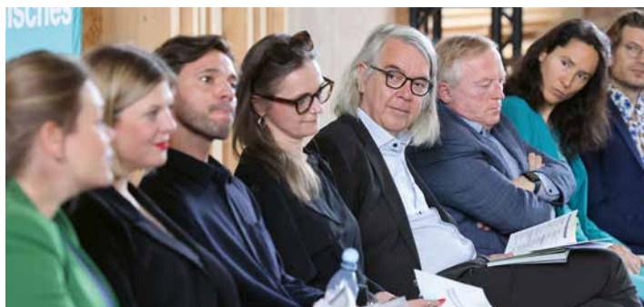
Das Leitungsteam des Mecklenburgischen Staatstheaters

Die humanistische Tradition des Theaters in den Vordergrund zu rücken – das war dem Team auch mit Blick auf die Landtagswahlen in MV am 20. September wichtig. „Freiheit ist das Herz unserer Kunst, sie ist das Einzige, das niemals auf dem Spiel stehen darf“, sagte Wegner. Stattdessen stehe das Haus für Menschlichkeit, die Bereitschaft, Einflüsse von außen aufzunehmen