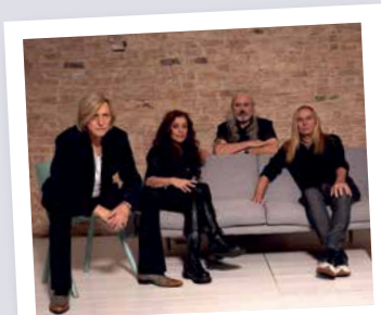
Silly kommt am 1. August mit der elektroAkustik-Tour nach Schwerin.

Silly tourt zusammen mit Sängerin Julia Neigel und Fans dürfen sich auf eine neue Interpretation der größten Hits freuen: Mont Klamott, Bataillon d'Amour, Paradiesvögel ... Die neu arrangierten Stücke werden hauptsächlich mit akustischen Instrumenten gespielt – und das kommt an! Zur Tour 2024/25 gehörten 27 ausverkaufte Konzerte, 30.000 begeisterte Besucher sowie Spielstätten von beson-