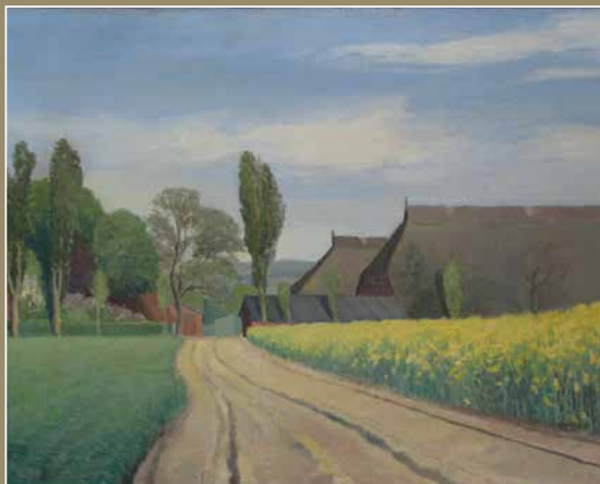
Karl Christian Klagen: Rapsfeld mit Bauernhäusern. Öl auf Leinwand um 1936. Foto: Karl Christian Klagen Gesellschaft e.V.