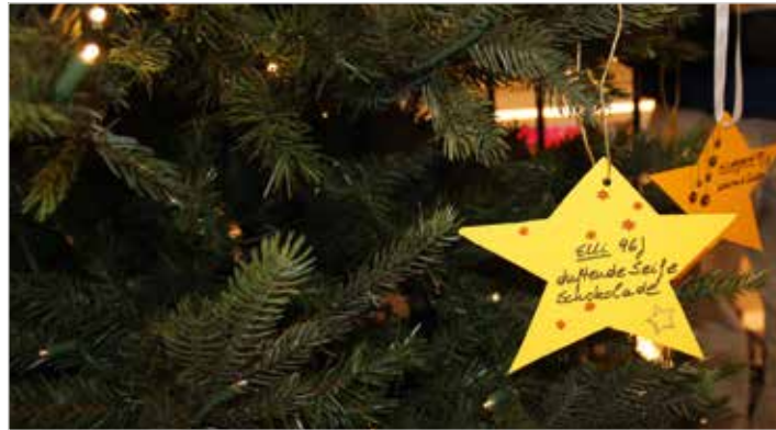
Mit Wünschen von Senioren schmückten die Malteser einen Baum in der Marienplatz-Galerie – innerhalb kurzer Zeit waren die Wünsche erfüllt.

Sie schreibt: „Gertrud, 99 Jahre, sitzt vor dem Fernseher und fragt zuallererst „was kostet das“, als ich mit dem großen Paket mit der Kuscheldecke ankomme. Sie kann es gar nicht glauben, dass die schöne Plüschdecke, gefüttert mit einem schönen glänzenden Stoff, nur für sie gekauft wurde. Sie verschwindet komplett in dieser wunder-