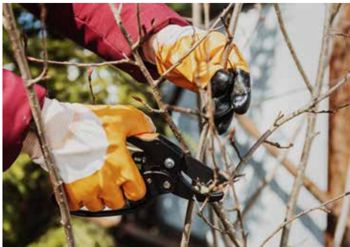
Gehölzpflege für besseres Wachstum – dafür ist jetzt die richtige Zeit.

würden. Und wenn auch eine auf den Stock gesetzte Hecke im ersten Moment ein trauriges Bild bietet: Schon im Frühjahr beginnt das große Wachsen und Blühen und die winterliche Gehölzpflege wird mit vielen neuen und robusten Trieben belohnt. ■