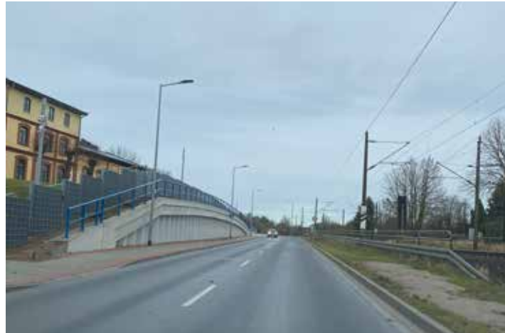
Asphalt und ein neuer Gehweg: Die Rogahner Straße ist seit wenigen Wochen wieder komplett befahrbar.

Die Fahrbahn der Rogahner Straße hat jetzt eine Asphaltoberfläche und wurde durch einen straßenbegleitenden Fußweg auf der Ostseite ergänzt. Dieser wird nach Fertigstellung durchgängig bis zum Obotritenring führen. Die Endabnahme wird Ende Mai erfolgen, wenn alle Restarbeiten an den Nebenanlagen ausgeführt sind. Teilweise wird es dafür ab März zeitweise noch zu halbseitigen Straßensperrungen kommen. ■