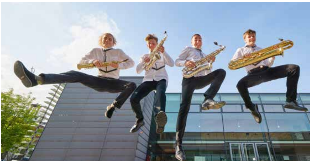
Saxophon-Quartett beim Bundeswettbewerb Jugend musiziert 2023

Regionalwettbewerb von „Jugend musiziert“ vom 19. bis 21. Januar