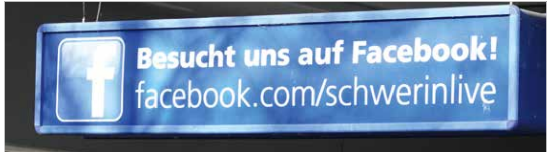
Die beleuchteten Visitenkarten gibt es auf Ebene 1 und 2, auf der zweiten Ebene sind sie auch von außen zu sehen.

Die mit LED ausgestatteten, so genannten „Visitenkarten“ sind Leuchtkästen auf den Parkebenen 1 und 2 und auf der zweiten Ebene