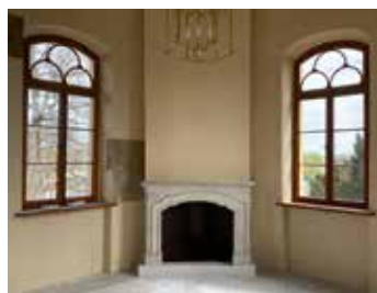
Der Grundriss ist achteckig, davor befindet sich ein rechteckiges Vestibül.