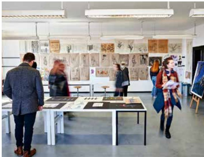
Der Beruf des Grafikdesigners ist facettenreich – in der Designschule gibt es eine praxisnahe Ausbildung.

Die Ausbildungsinhalte zum Grafikdesigner: