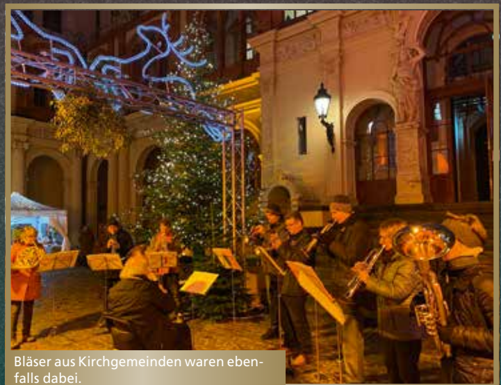
Bläser aus Kirchgemeinden waren ebenfalls dabei.