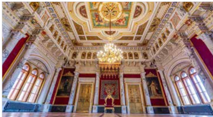
Was für eine Pracht: Der Thronsaal ist das Herz der Beletage.

Im bundesweiten Vergleich liegen Besucher aus Nordrhein-Westfalen, Niedersachsen und Schleswig-Holstein sowie Berlin und Hamburg vorn. Ausländischen Gäste machen einen Anteil von rund 17 Prozent aus und kommen vor allem aus der Ukraine, den Niederlanden und Skandinavien. Über 18 Prozent der Besucher kommen aus dem eigenen Land. Gegenüber 2022 ist vor