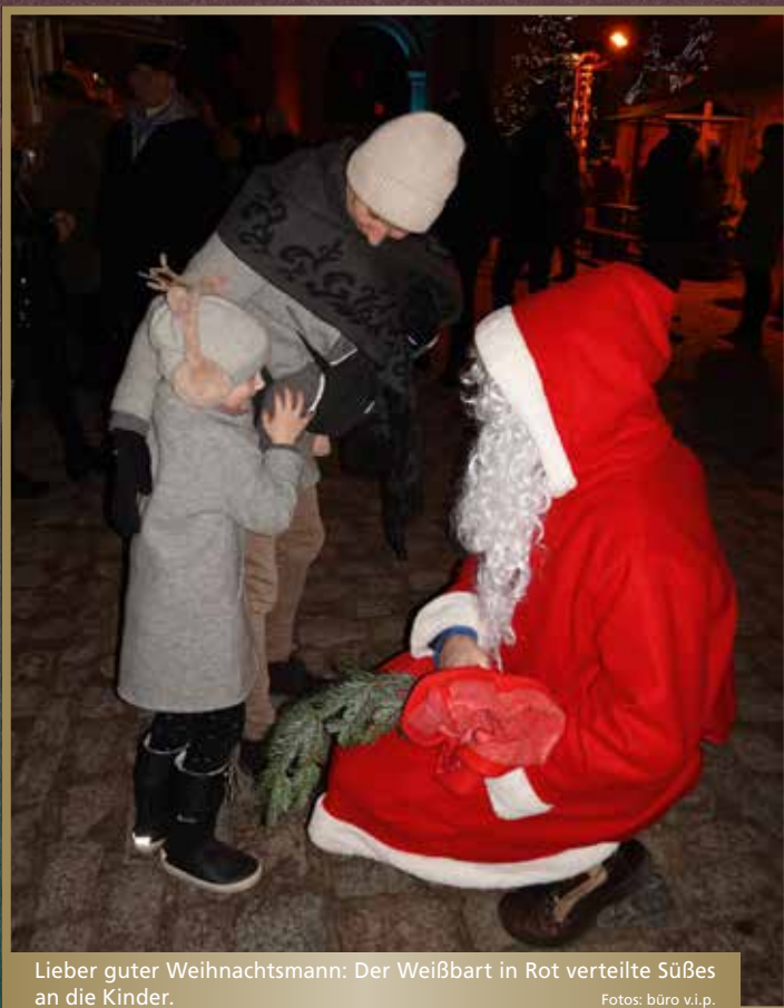
Lieber guter Weihnachtsmann: Der Weißbart in Rot verteilte Süßes an die Kinder.