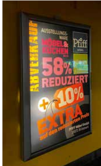
Beispiel für ein City-Light in einer Größe von ca. 117 x 175 Zentimetern