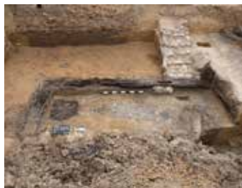
Spätmittelalterlicher Holzkeller mit Treppe

Ende der 1980er Jahre planten Stadt und Bezirk Schwerin den Abriss von Teilen der mehr als 300 Jahre alten Schelfstadt. Trotz des Widerstandes Schweriner Bürger gegen dieses Vorhaben wurden im September 1988 drei Wohn- und Geschäftshäuser in der Puschkinstraße 23, 25 und 27 gesprengt. Der Protest einer Bürgerinitiative und das Ende der DDR verhinderten die weitere Umsetzung der Pläne und das historische Stadtbild auf der Schelfe konnte weitgehend