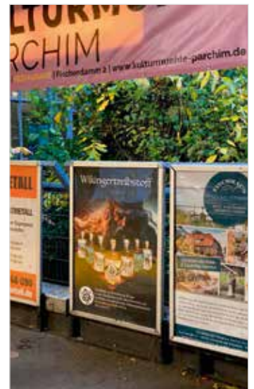
Die A0-Rahmen gibt es zum Einsteigerpreis für 80 Euro im Monat.