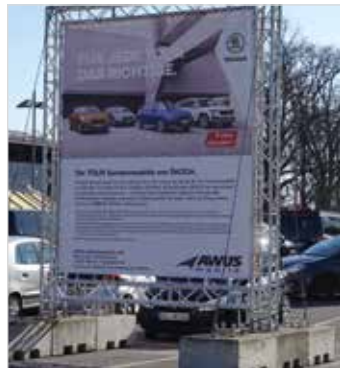
Auffällig und zentral: Sonderwerbefläche auf der obersten Parkebene