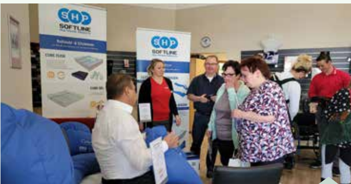
Tag der offenen Tür bei Kowsky: Termine wie dieser stoßen auf viel Interesse.

Kowsky bietet auch in diesem Jahr wieder verschiedene Thementage an