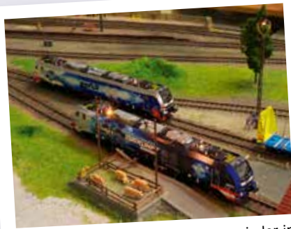
Miniaturzüge sind ab 10. Februar wieder in Schwerin unterwegs.

Die Anlage besteht aus mehr als 100 Modulteilen – auf einer Gleislänge von 400 Metern können Besucher hier den Zugverkehr verfolgen. Besonders viel Interesse finden dabei die Bahnhöfe und Bahnbetriebswerke, groß ist hier die Vielfalt von Lokomotiven, Triebwagen und Waggons. Die Zuggarnituren setzen sich überwiegend epochenrein zusammen, es verkehren eine große Anzahl von Mo-