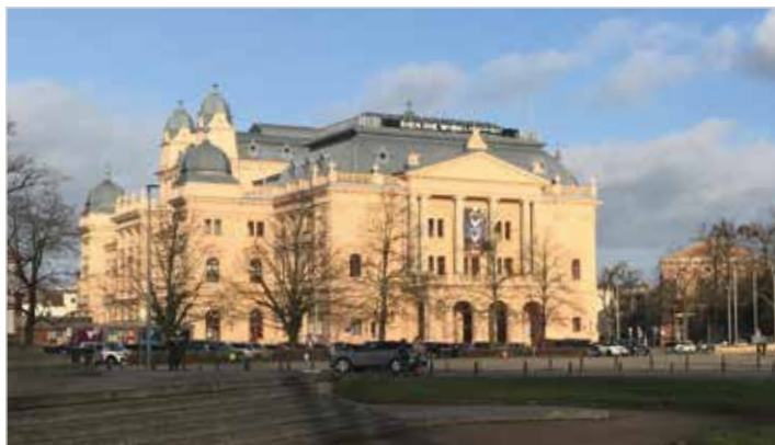
Auch 2024 wird es spannend im Mecklenburgischen Staatstheater.

Die Kulturmühle Parchim, die im Mai 2023 eröffnet wurde und bislang überwiegend vom Jungen Staatstheater bespielt wurde, zeigt sich als Publikumsmagnet. In diesem Jahr werden hier auch die anderen Sparten verstärkt zu erleben sein. Los geht es im Januar mit der Fritz-Reuter-Bühne, welche die Premiere von „Bliw doch taun Frühstück“ am 20. Januar in der