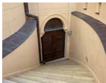
Vom Ehrenhof führt eine Treppe auf die Nordbastion, zugänglich ist der Pavillon im Rahmen von Führungen.