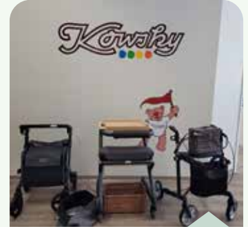
Sale-Angebote und Lösungen rund um das selbstständige Leben zu Hause: All das gibt es im Sanitätshaus Kowsky.