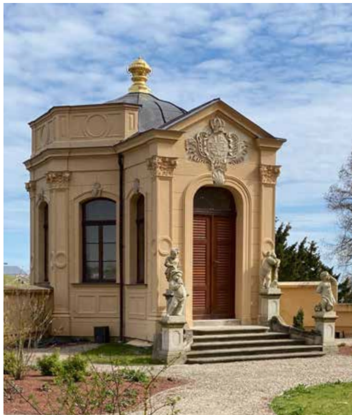
Teepavillon mit den Kopien der Sandsteinfiguren, vorn rechts die Nachbildung des Winters, dahinter der Sommer, links Herbst (vorn) und Frühling.

Anständige Kanonen – in diesem Fall waren es schwere Schiffsgeschütze – ziemten sich natürlich auch für eine Bastion: Im 16. Jahrhundert hatte Renaissanceherzog Johann Albrecht I.