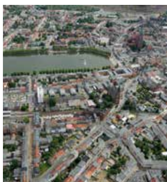
Auch in der Schweriner Innenstadt ist nur ein geringer Anstieg der Mieten zu verzeichnen.

Für den neuen Mietspiegel 2024/25 standen Daten von 25.826 Mietwohnungen zur Verfügung. Dabei handelt es sich um 10.771 Bestandsmieten und 15.055 Neuvertragsmieten. Diese Stichprobe liefert sichere Angaben zur Feststellung der ortsüblichen Vergleichsmiete. Frei vereinbarte Mieten sind im untersuchten Zeitraum vom 1. September 2017 bis 31. August 2023 im gesamten Stadtgebiet um durchschnittlich 3,8 Prozent gestiegen. Die Art, Größe, Ausstattung und Lage einer Wohnung einschließlich der energetischen Ausstattung und Beschaffenheit sind weiterhin wichtige Faktoren für die Miethöhe. Die Wohnungsmieten in Schwerin