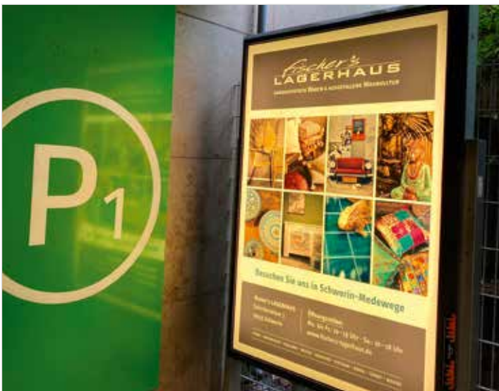
So genannte City Lights setzen Werbung auf der oberen Parkebene effektiv in Szene – es gibt sie für 200 Euro im Monat pro Standort zzgl. Plakat.

Interessiert? Bei büro vip gibt es unter gutentag@buero-vip.de und 0385-6383270 alle weiteren Informationen.