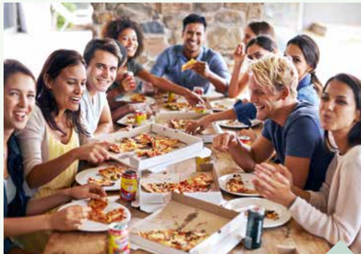
Ein Pizzatessen mit guten Freunden macht Spaß und bringt Farbe in den Januar.

Das Stimmungstief zu Beginn eines Jahres ist bekannt und gefürchtet. Doch dagegen lässt sich etwas tun – mit Aktivität, Begegnungen und weiteren Wohlmomenten. Einer der wichtigsten Tipps lautet: Ab nach draußen. Da mag es noch so dunkel sein – mehr Licht als unter