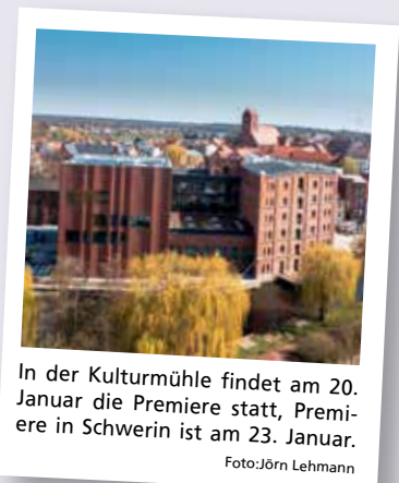
In der Kulturmühle findet am 20. Januar die Premiere statt, Premiere in Schwerin ist am 23. Januar.

„Regeln! Zivilisiert! Wat bringt dat allens? Is doch för'n Nors“: Als die 19-jährige Luise aus der WG nebenan hochschwanger in Georgs Wohnung platzt, rüttelt das quirliche Partygirl das geordnete Dasein des gesetzten Mittdreißigers mächtig durcheinander. Was aber soll ein von seiner Frau verlassener Postbeamter mit einem flüchtigen Landei voll Lebenshunger anfangen und umgekehrt. Schnell hauen sie einander die Klischees um die Ohren, als aber bei ihr die Wehen