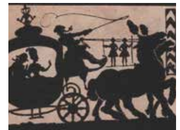
Beschwerliches Reisen mit der Kalesche – auch das zeigt die Ausstellung.