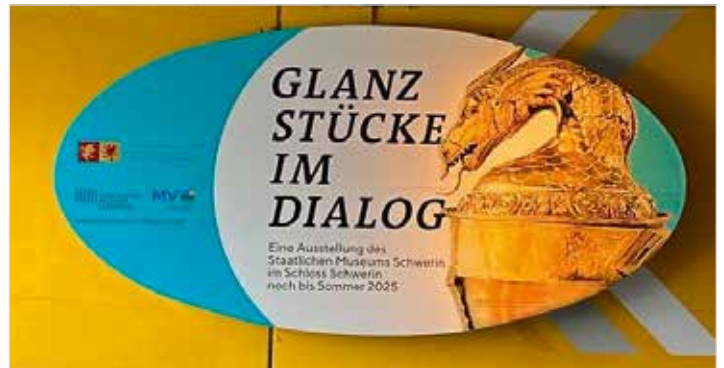
Die ovale Fläche an der Parkhauswand lässt sich von hinten beleuchten.