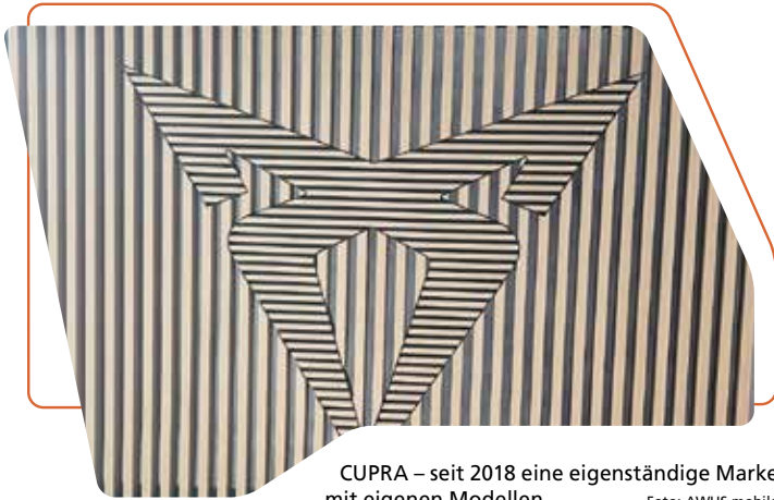
CUPRA – seit 2018 eine eigenständige Marke mit eigenen Modellen.