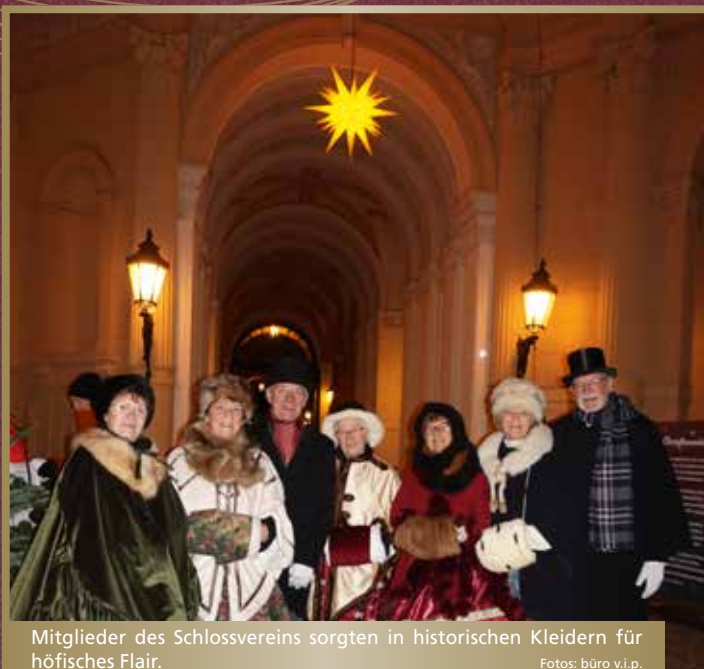
Mitglieder des Schlossvereins sorgten in historischen Kleidern für höfisches Flair.

Konzerte, Kulinarisches und Kunsthandwerk lockten in Schlossinnenhof