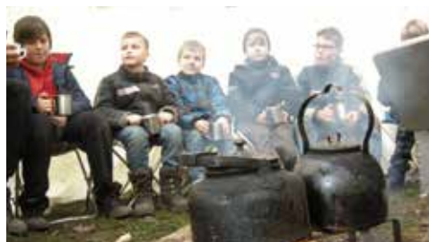
Schloss Dreilützow: Kinder können hier Kreativtage erleben.