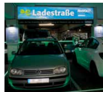
Selbst an der E-Tankstelle „Ladestraße“ lässt es sich werben.