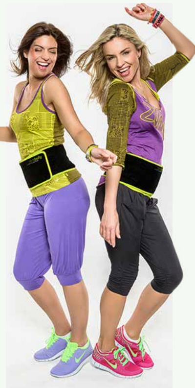
Zumba mit Slim Belly – einer der beliebtesten Kurse, der doppelt wirkt

Eine gute Ernährung sowie eine sinnvolle sportliche Betätigung sind die hauptsächlichen Erfolgskatalysatoren für die Wohlfühlfigur. Ist die Wohlfühlfigur dann da, steigt die Lebensqualität und damit das Lebensglück. Dies ist wiederum wichtig für einen dauerhaft schlanken und gesunden Kör-