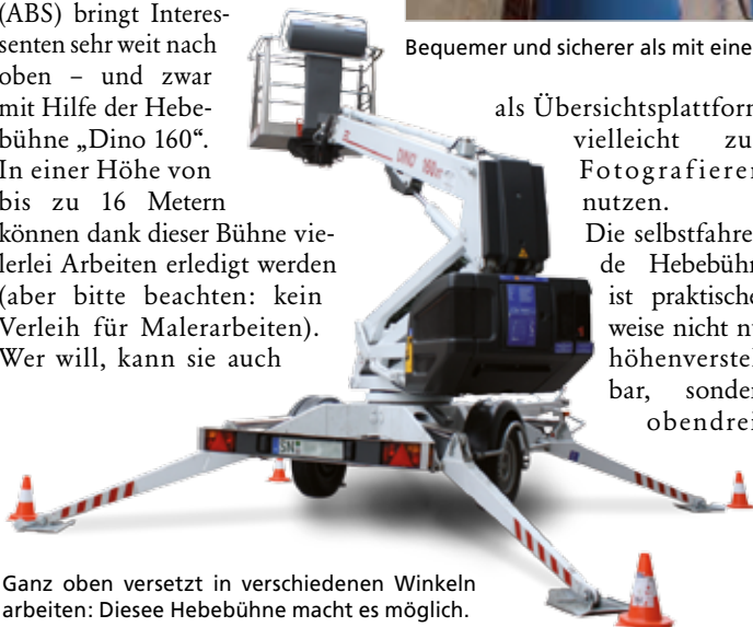
Ganz oben versetzt in verschiedenen Winkeln arbeiten: Diese Hebebühne macht es möglich.