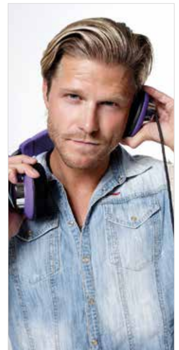
Mit dabei ist auch Paul Janke, einst bekannt als „Der Bachelor“.

für 16,20 Euro, an der Kongresshalle und bei der Tourismusinformatio für 15,95 Euro (je inklusive Gebühr). ■ ue30-planer.de