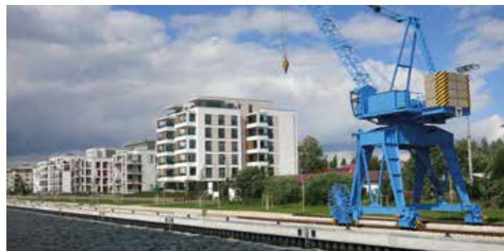
Vor dem Haus die neue Promenade, dann erstmal nur Wasser: Die Bewohner des Hauses genießen einen unverbaubaren Blick über den Ziegelinnensee.