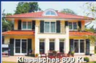
Klassisches 800 KL

Nichts überzeugt mehr an einem Haus als seine Architektur und die Qualität seiner Ausführung.