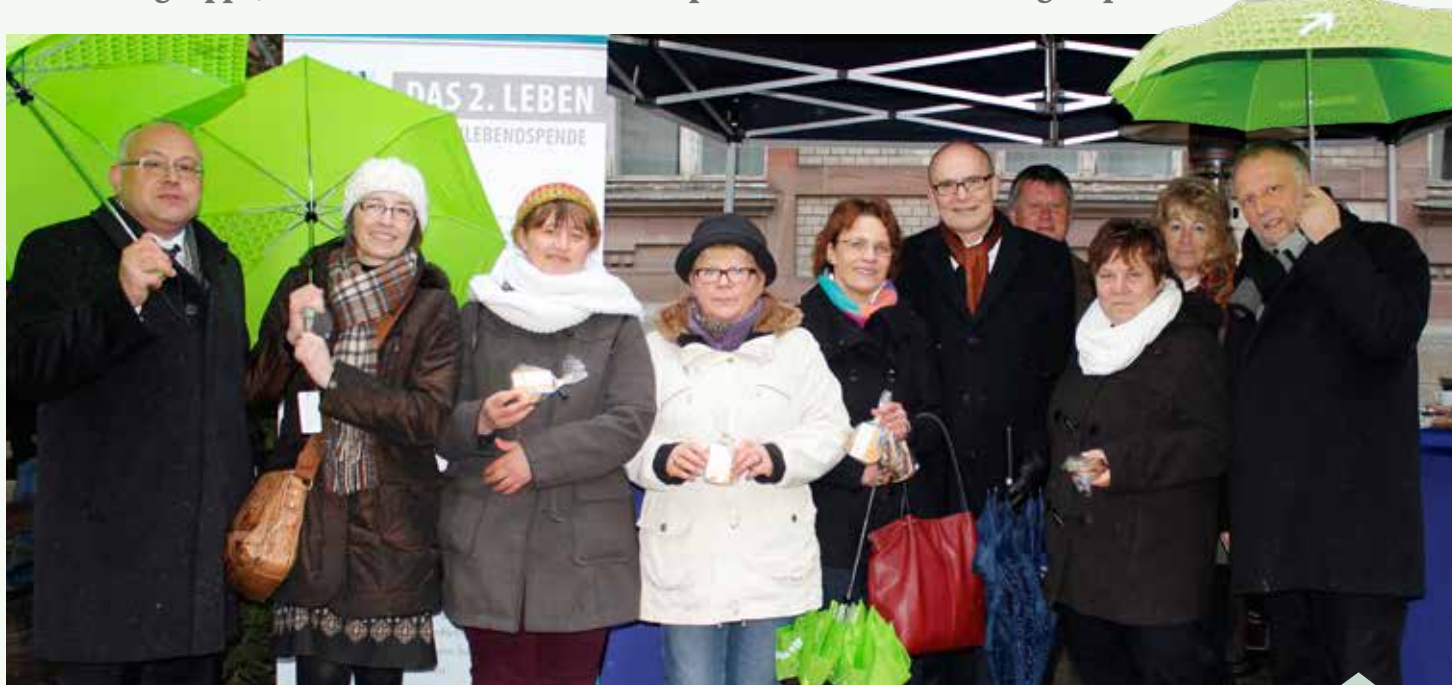
Ministerpräsident Erwin Sellering (5. v. r.) unterstützte die gemeinsame Aktion der Selbsthilfegruppe „Das zweite Leben“ und der BARMER GEK.

Selbsthilfegruppe, BARMER GEK und Ministerpräsident warben für Organspende