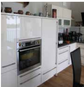
Modern und sachlich: Gut ausgestattet sind die offenen Küchen.

In den Hafenvierteln dominieren sonst jedoch Eigentumswohnungen. Daher betonte die SWG auch zu Baubeginn: „In der ersten, dem See zugewandten Reihe sind wir der einzige Bauherr, der dort Mietwohnungen errichtet.“ Stefan Krieg