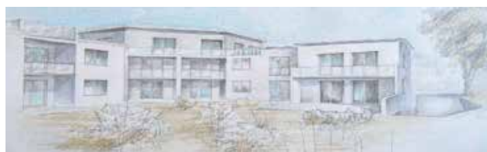
Ansicht des Hauses in der Güstrower Straße – Front- (o.) und Gartenseite (u.)

Bäder und Nebenräume orientieren sich nach Osten oder Norden, also zur Straßenseite.