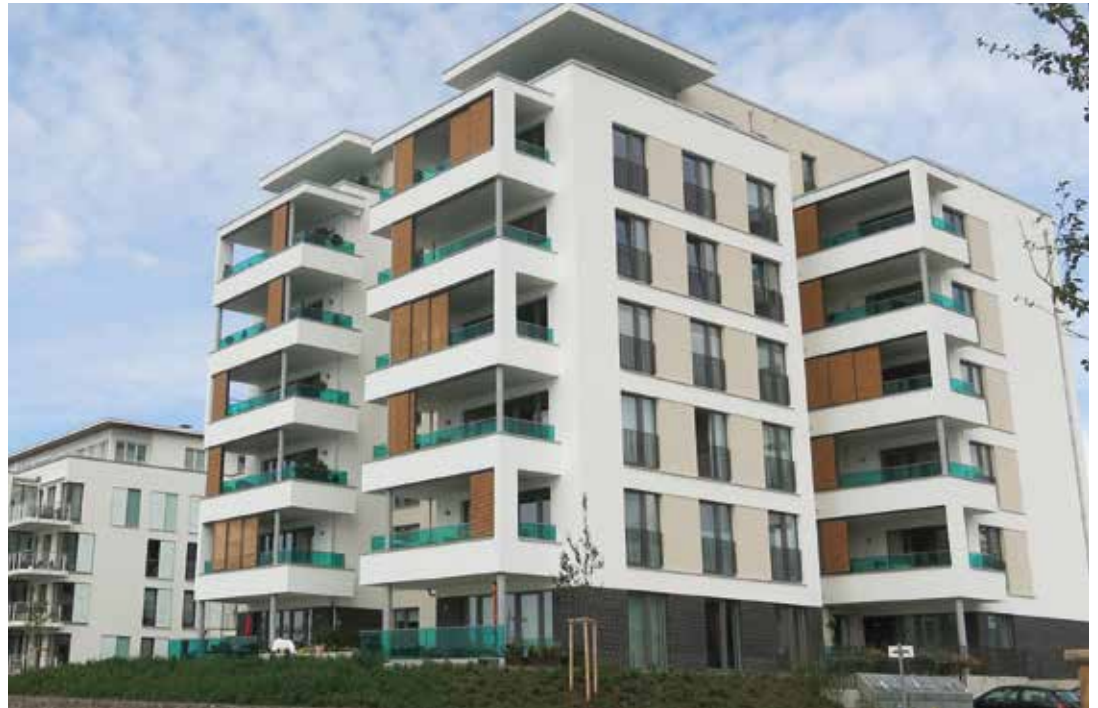
Die siebengeschossige Stadtvilla HQ 9 umfasst 26 Drei- und Vierraumwohnungen und verfügt über eine Tiefgarage und einen Fahrstuhl. Die braunen Schiebe-Elemente an den Balkons bringen im Sommer Schatten.

Etwa 5,4 Millionen Euro hat sich die SWG nach eigenen Angaben das