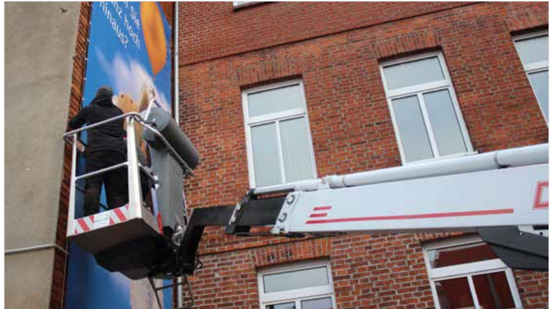
Bequemer und sicherer als mit einer Leiter: Mit dem „Dino 160“ lässt sich's auch an hohen Hauswänden arbeiten.