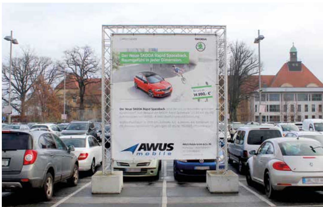
Übersehen unmöglich: Beim Auffahren aufs oberste Parkdeck kommt man genau auf das große Werbebanner zu.

■ An Werbung im Parkhaus interessiert? Bei „büro v.i.p.“ anrufen! Ansprechpartner für Interessenten ist Oliver Schöner – Telefon: 03 85 / 63 83-270.