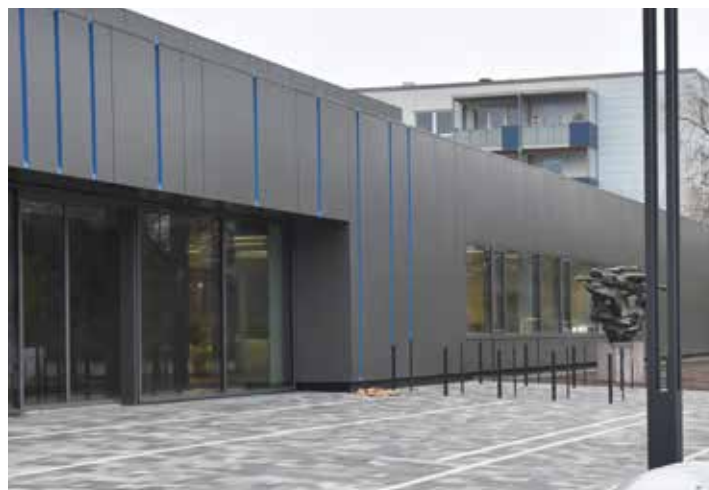
Außenansicht des Eingangsbereichs. Die Skulptur „Die Schwimmenden“ wurde von der Lankower Halle zur neuen Halle gebracht.