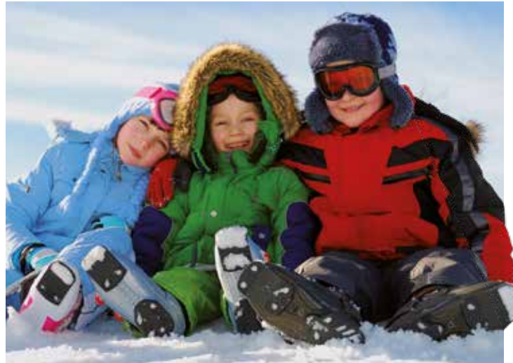
„alpincenter“ Wittenburg: im Feriencamp Ski fahren lernen

Am Donnerstag und Freitag, 12. und 13. Februar, gibt es jeweils gleich zwei Angebote. Kleine Prinzessinnen und Prinzen lernen etwas über Hofknicks und Handkuss, „Greif und Stier – die Sprache der Wappen“ lautet das zweite Thema, und wer möchte, kann