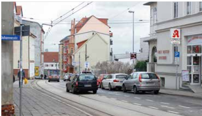
Die Brücke in der Wittenburger Straße wird abgerissen und neu gebaut. Eine Fußgängerbehelfsbrücke in der Bauphase ist bisher nicht geplant. Fotos: SN live

Marco Bubnick möchte, dass Fußgänger auch während des Neubaus die Schienen queren können