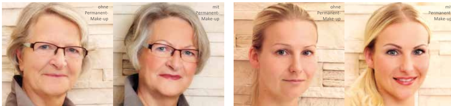
Die Konturen der Gesichtszüge werden mittels Permanent-Make-up schärfer nachgezogen, und die natürliche Schönheit wird somit hervorgehoben.

„Céleste Beauté Contour“ – Ihr Elite-Partner-Studio in Schwerin