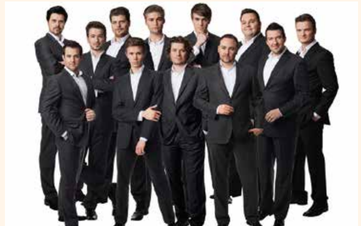
Diese zwölf Männer können mehr als schön singen.

The 12 Tenors am 21. Februar live im Capitol