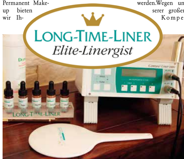
Nur ausgewählte Studios dürfen den Titel „Long-Time-Liner Elite Linergist“ tragen. „Céleste Beauté Contour“ gehört dazu.