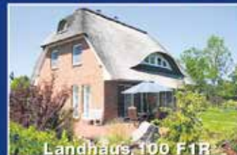
Landhaus 100 F1R