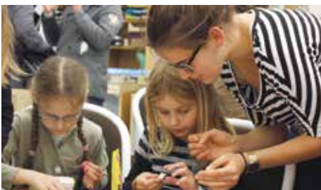
Schlossmuseum Schwerin: Schätze entdecken und selbst basteln

Fantastisch: Bei „Karls“ in Rövershagen nahe Rostock lockt die neue Eisskulpturen-Ausstellung „Eiswelt“ mit dem Motto „Rock ‘n’ Roll“ zu einem Besuch – auch in den Ferien ist täglich 9 bis 19 Uhr geöffnet. ■