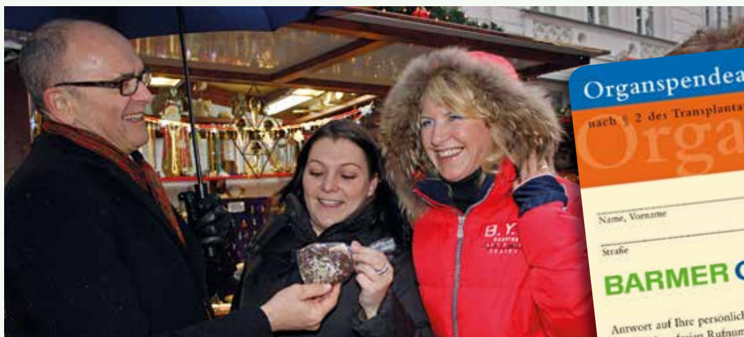
Der Ministerpräsident überreichte Passanten Spekulatiusherzen und Organspendeausweise.

Die Selbsthilfegruppe fand sich in der Reha-Einrichtung „Müritz Klinik“ in Klink zusammen und wird weiter von ihr unterstützt. ■ www.das-zweite-leben.de