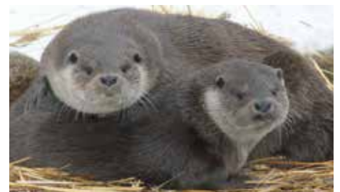
Zoo Schwerin: Auch im Winter kann man Tiere beobachten, zum Beispiel Fischotter.