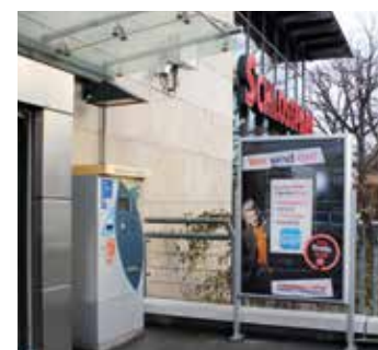
Auffällig: Werbung am Eingang