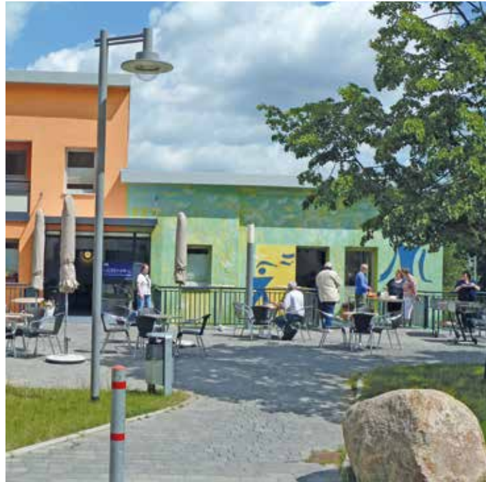
Farbenfroh: Das Nachbarschaftszentrum in der Wuppertaler Straße kann sich von innen wie von außen sehen lassen.

Sich bei dem Verein „Hand in Hand“ zu engagieren, gibt es zahlreiche Möglichkeiten. Wie wäre es zum Beispiel, im Bewohnerbeirat mitzuwirken? Oder eine Arbeitsgruppe zu leiten? Oder einfach Veranstaltungen mit zu organisieren? Dazu muss man nicht unbedingt Mitglied werden. Der Vereinsbeitrag unterstützt die Arbeit finanziell