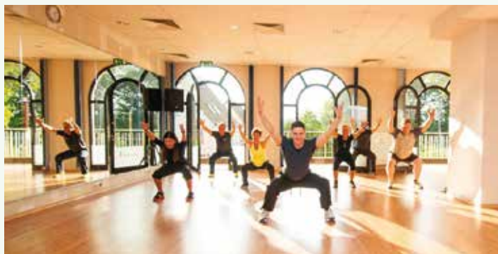
Sport hilft, Stresshormone abzubauen.

Im „Vital am See“, dem Gesundheits- und Fitnessstudio in Raben Steinfeld, gibt es eine Lösung. Es ist schon lange kein Geheimnis mehr, dass moderater Fitnesssport sowohl Stresshormone abbauen kann, als auch den Körper so in Schwung bringt, dass mehr Energie für Arbeit und Freizeit zur Ver-