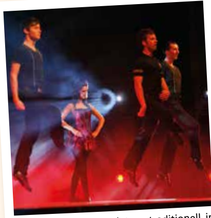
Auch Luftsprünge gehören traditionell in das Tanzprogramm.

Die gesamte Aufführung wird übrigens zusätzlich auf ein gro-