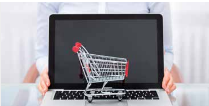
Der Verkäufer ist gegenüber dem Käufer nicht schutzbedürftig.

Gebrauchtwagen zum „Schnäppchenpreis“ von nur einem Euro?