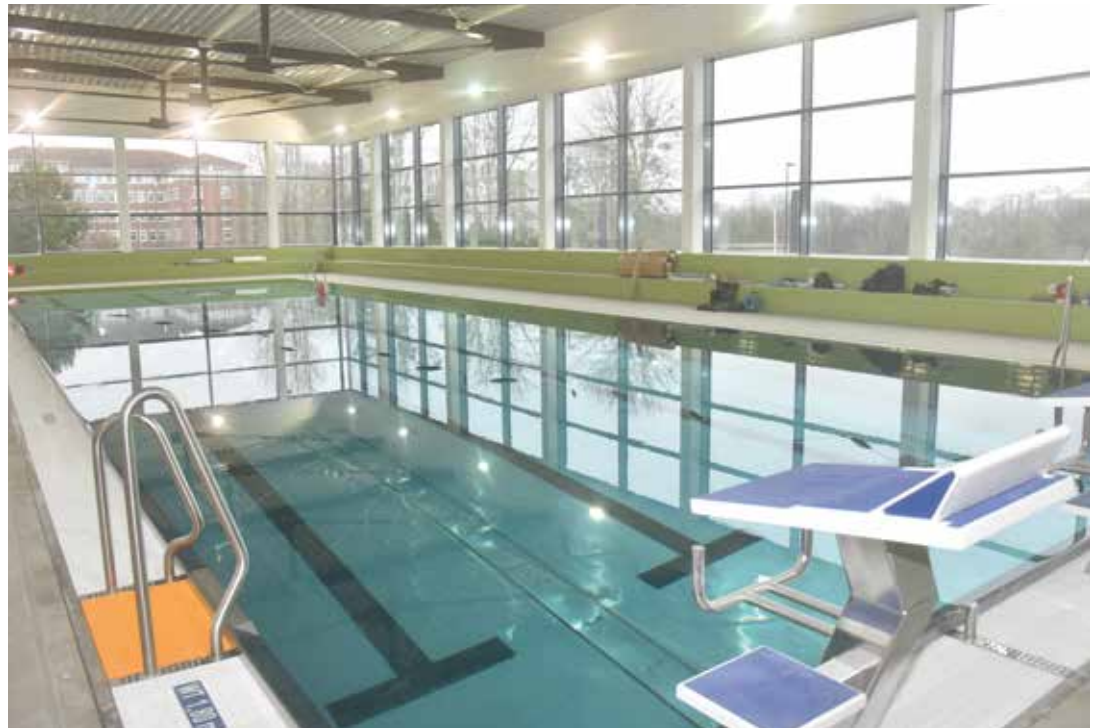
Die Farbgestaltung ist an den Weg zur Ostsee angelehnt: Von Grün über Gelb zu Blau.

Ab 29. Januar, 10 Uhr, steht die neue Schwimmhalle offiziell zur Verfü-