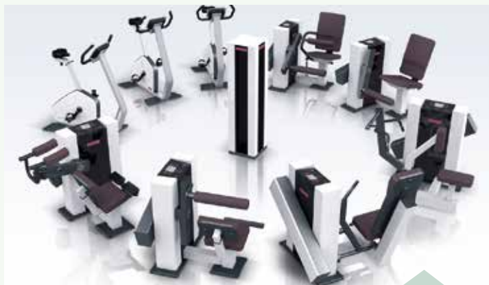
Der Physio-Zirkel besteht aus neun Geräten und einer Art Ampel.

Am 24. Januar ab 13 Uhr wird bei der Physiotherapie Aline Just ein neues Zirkeltraining vorgestellt