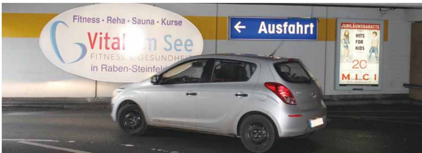
Auch das hinterleuchtete Oval ist eine Werbefläche, sie ist an der Ausfahrt vom Parkdeck 2 perfekt platziert.

Werbung, die wirklich auffällt: auf den Parkdecks im Schweriner Schlosspark-Center