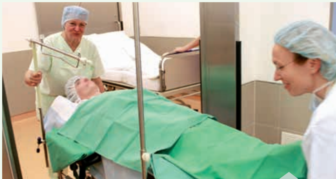
Eine Patientin wird in den OP-Trakt geschoben. Die Patienten-Schleuse gewährleistet die strikte Trennung von normalem Krankenhausbetrieb und Operationsbereich.