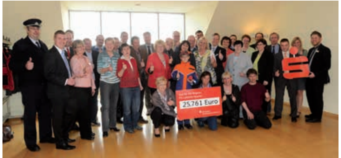
Vertreter aus 21 Vereinen freuten sich über die finanzielle Unterstützung der Sparkasse