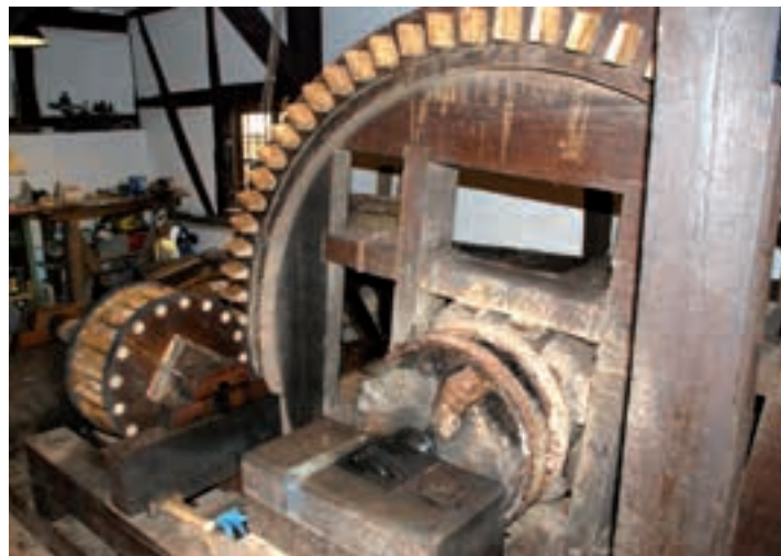
Im Inneren der Schleifmühle können Besucher die Mühlentechnik in Aktion erleben.