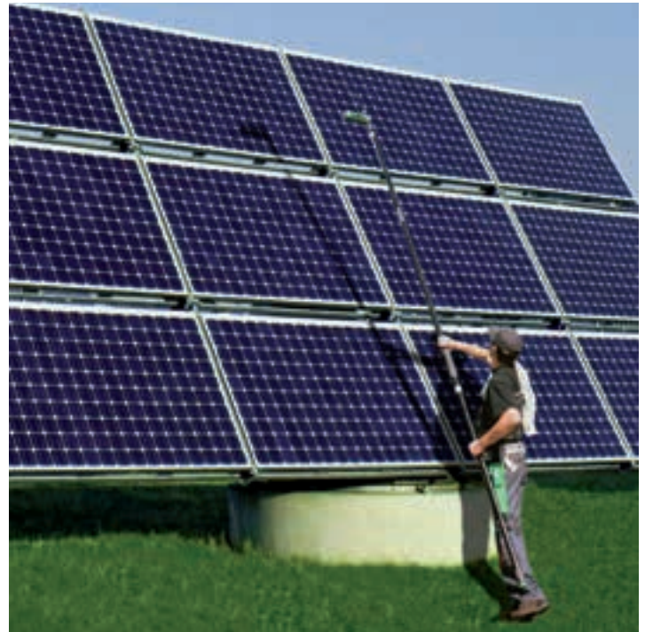
Leiter überflüssig: Mit der bei der Reinstwasseranlage können über einen langen Stab auch hohe, große Flächen ohne Mühe erreicht werden.

Wahl; gar nicht zu reinigen, empfiehlt sich erst recht nicht. „Die Anlagen sind meistens relativ unzugänglich“, beschreibt Christian Feichtinger, Meister des Glas- und Gebäudereinigerhandwerks und Inhaber des HDS Haus- und Dienstleistungsservice, „dort sammeln sich natürlich die Ablagerungen von Abgasen, Pollen und Staub. Sich auf den Regen als natürlichem Reiniger zu verlassen, reicht meistens nicht aus.“ Die optimale Reinigungslösung für Solaranlagen – und übrigens auch für hohe Fenster und Glasfassaden – heißt Osmosewasser: Eine kleine, handliche Filteranlage liefert dieses Reinstwasser, also entmineralisiertes, von allen Partikeln befreites Wasser. Es zieht Schmutz an wie ein Magnet. Über eine lange Wasserstange mit Bürstenkopf auf die Fläche geleitet, befreit es Solarmodule und andere glatte Oberflächen von jeglicher Verunreinigung. Das Beste: Die Wieder-Verschmutzung wird durch das Verfahren außerdem deutlich erschwert. ■