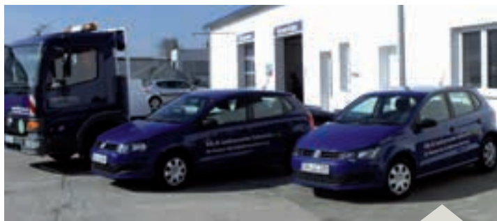
Abschlepp- und Ersatzfahrzeuge gehören in beiden Niederlassungen zum Standard.