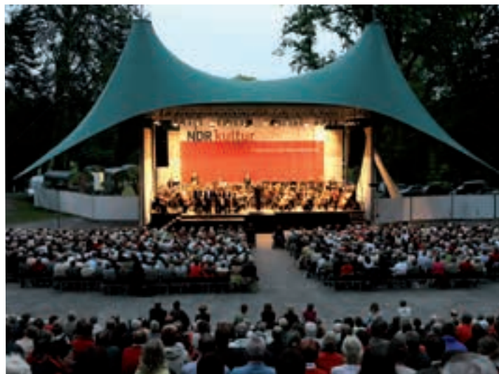
Jedes Jahr ein Hochgenuss: die „MeckProms“