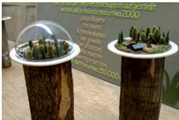
Detailreiche Modelle geben Einblick in das Ökosystem Wald; im Hintergrund der über fünf Meter hohe Buchstaben-Baum.

Begonnen im „Internationalen Jahr des Waldes 2011“, angeknüpft an das Projekt „Bäume für die Mongolei“ haben Schüler des Gymnasiums unter der Leitung der Fachlehrerinnen Christine Detenhoff und Doreen Kaltenstein zwei Jahre gestrichen, gebastelt, geklebt sowie zusammengefügt, was zusammen gehört. Und was sie da geschaffen haben, kann sich sehen lassen: ein 5,30 Meter hoher und 3,90 Meter breiter Baum aus sage und schreibe 1.300 Holzbuchstaben. Der Text umschreibt den Wert eines Baumes und beim Lesen wird sehr schnell klar, welche Bedeutung Bäume für die Umwelt haben und was es heißt, wenn man diesen Baum z.B. für eine neue Garage fällen würde. Komplettiert wird dieser lebensgroße Buchstabenbaum durch fünf gebastelte Landschaftsmodelle, die die Bedeutung des Waldes darstellen. Er ist Wind-, Lärm- Lawinen- und Erosionsschutz, er erzeugt lebensnotwendigen Sauerstoff und bindet giftiges Kohlenstoffdioxid. Der Wald liefert viele Rohstoffe,