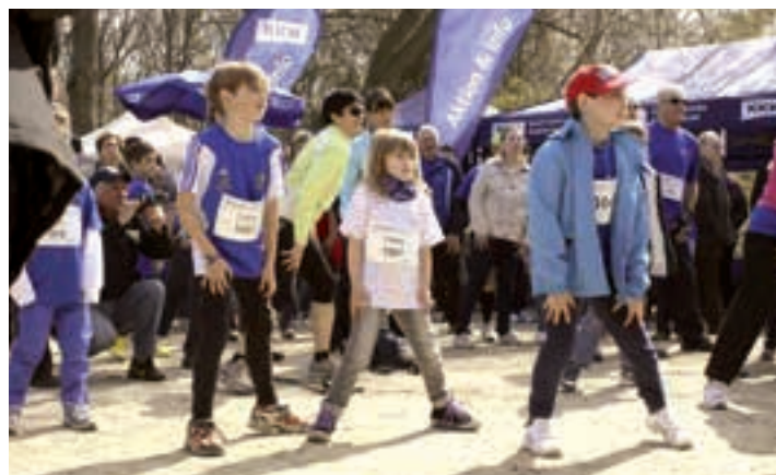
Auch am Berliner KKH-Lauf nahmen viele kleine Sportler teil.

groß, mit seiner Teilnahme automatisch Kindern in Not, denn alle Startgelder des KKH-Laufs gehen direkt an die Hilfsorganisation „Ein Herz für Kinder“. Zur Auswahl stehen Einsteigerlauf, Walking und Nordic Walking, Fitnesslauf sowie für die Jüngsten 200 m Bambini-Lauf und 800 m Schülerlauf. Anmeldung auf www.kkh.de/lauf . ■