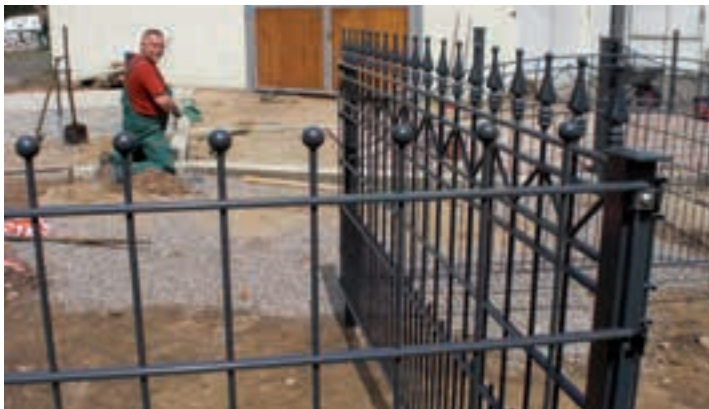
Letzte Arbeiten an der neuen Zaunausstellung bei P&T in Stern Buchholz.